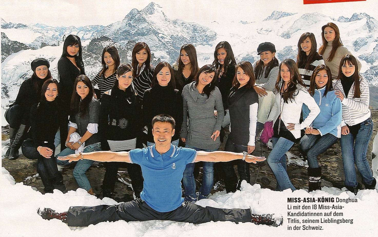
MISS-ASIA-KÖNIG Donghua Li mit den 18 Miss-Asia-Kandidatinnen auf dem Titlis, seinem Lieblingsberg in der Schweiz.